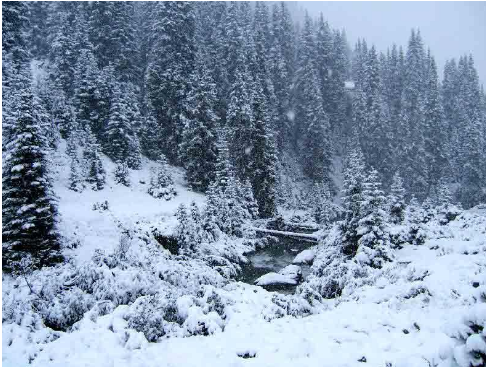
Het lijkt wel een Kerstkaartje