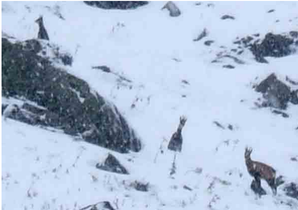
Hier zie je ze al wat beter