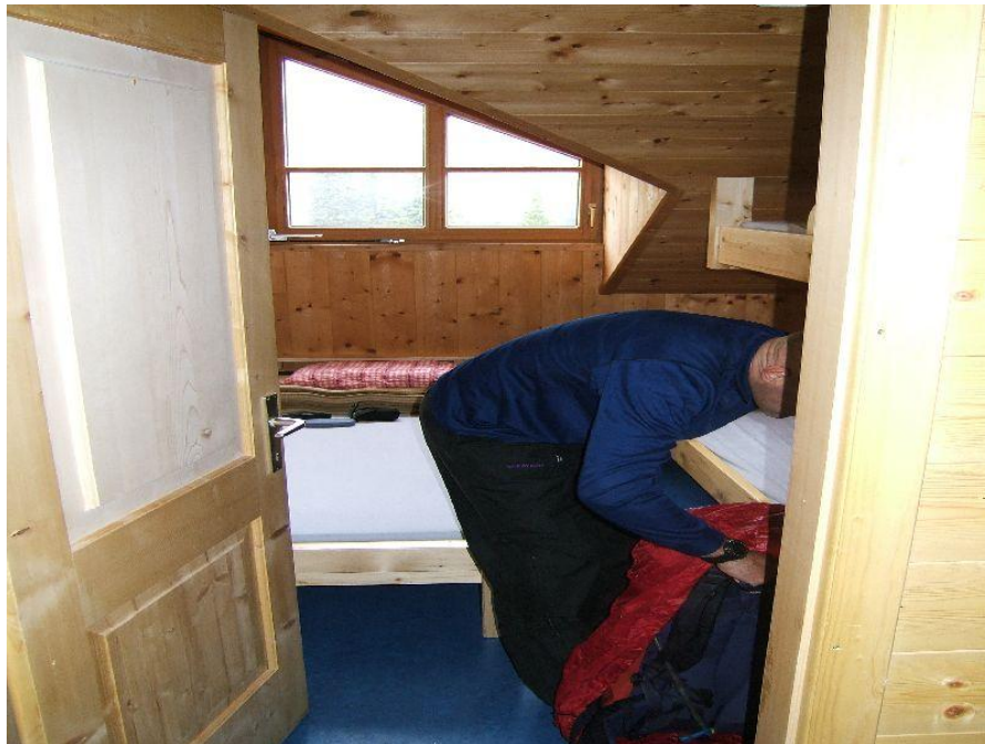
De kamertjes zijn wel nogal naar de krappe kant