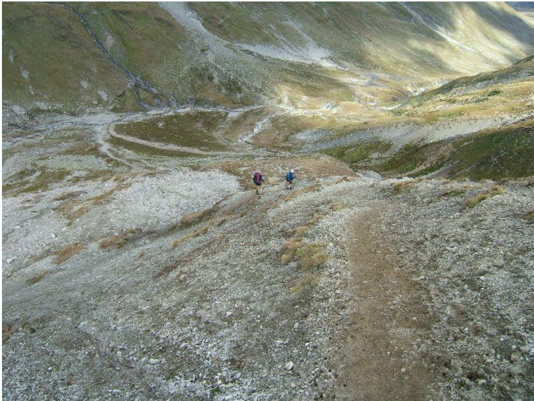
Herman en René in de afdaling