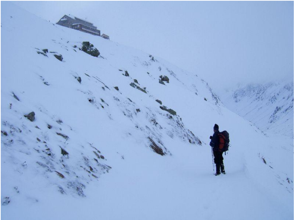
De Darmstädter Hütte komt in zicht