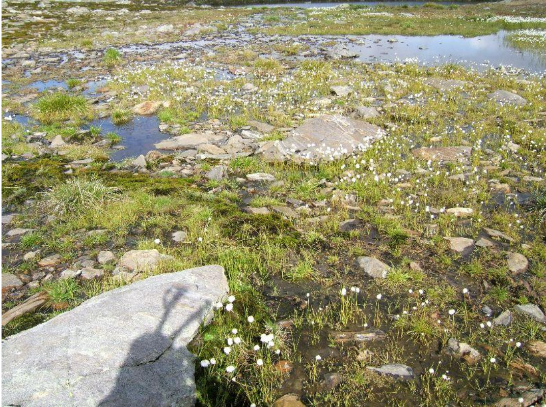
moerassig gebied met veenpluis